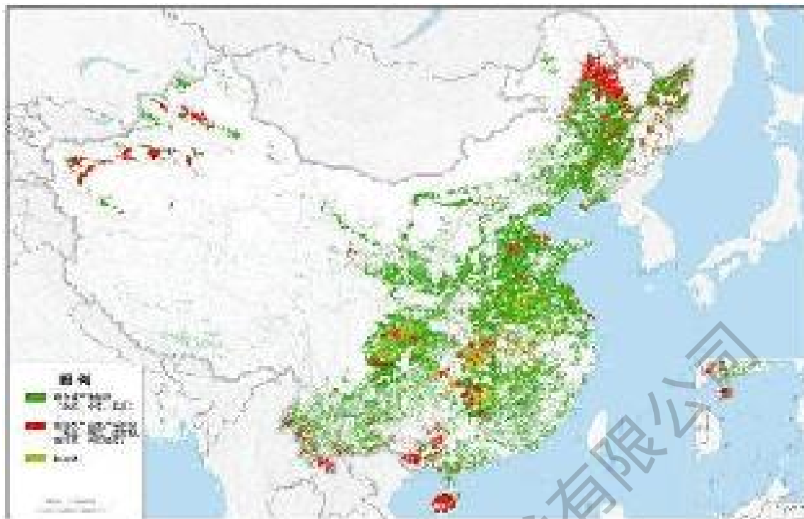
图1 粮食生产功能区及重要农产品生产保护区分布示意图