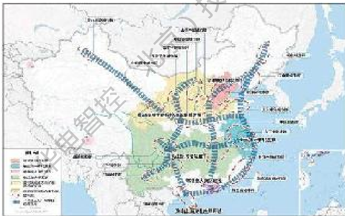
图 5 城镇化空间格局示意图

加快县城补短板强弱项，推进公共服务、环境卫生、市政公用、产业配套等设施提级扩能，增强综合承载能力和治理能力。支持东部地区基础较好的县城建设，重点支持中西部和东北城镇化地区县城建设，合理支持农产品主产区、重点生态功能区县城建设。健全县城建设投融资机制，更好发挥财政性资金作用，引导金融资本和社会资本加大投入力度。稳步有序推动符合条件的县和镇区常住人口20万以上的特大镇设市。按照区位条件、资源禀赋和发展基础，因地制宜发展小城镇，促进特色小镇规范健康发展。