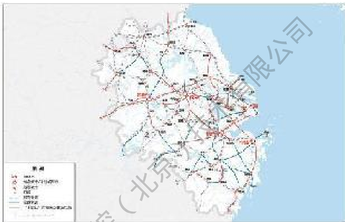
图 6 长三角地区轨道交通网络图

瞄准国际先进科创能力和产业体系,加快建设长三角G60科创走廊和沿沪宁产业创新带,提高长三角地区配置全球资源能力和辐射带动全国发展能力。加快基础设施互联互通,实现长三角地级及以上城市高铁全覆盖,推进港口群一体化治理。打造虹桥国际开放枢纽,强化上海自贸试验区临港新片区开放型经济集聚功能,深化沪苏浙皖自贸试验区联动发展。加快公共服务便利共享,优化优质教育和医疗卫生资源布局。推进生态环境共保联治,高水平建设长三角生态绿色一体化发展示范区。