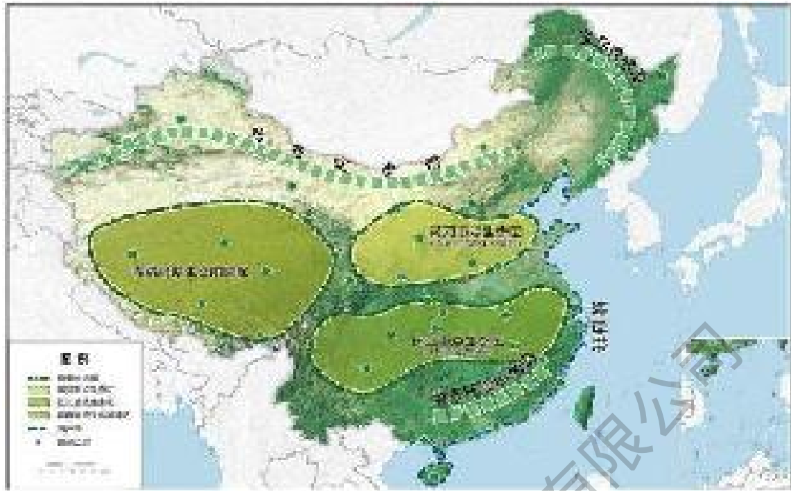
图7 重要生态系统的保护和修复重大工程布局示意图