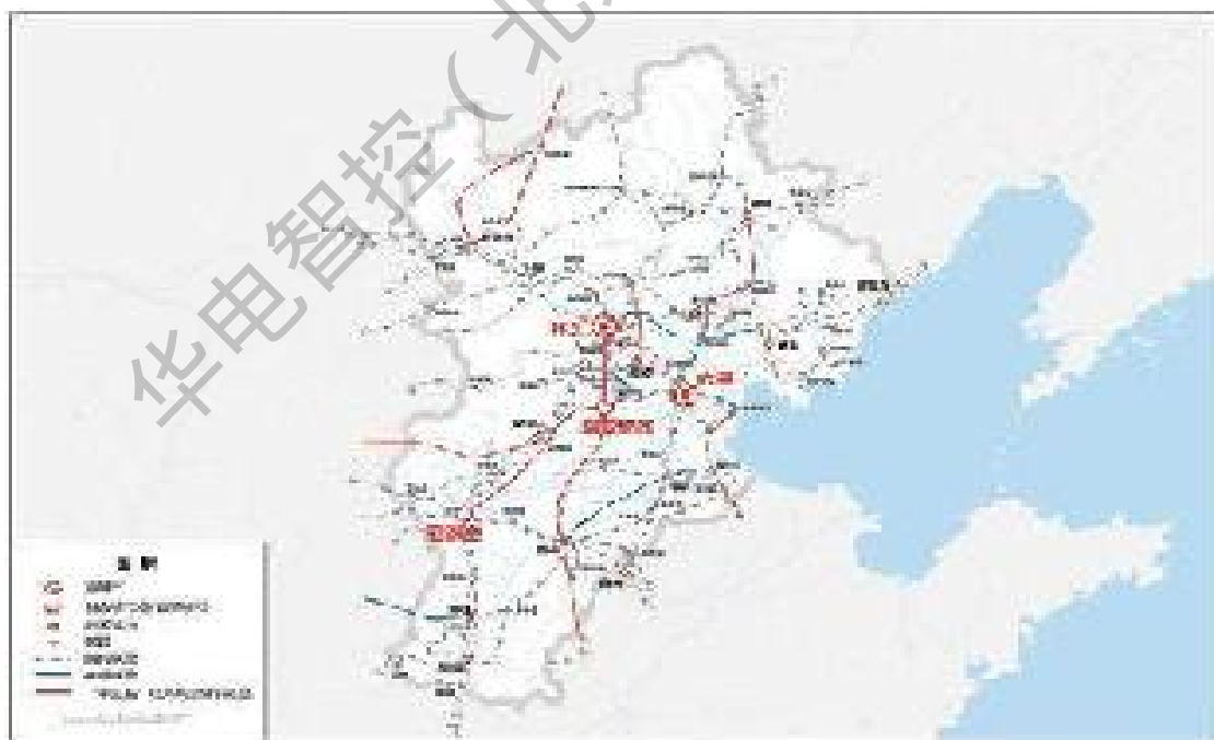
图 31-1 京津冀地区轨道交通规划图

紧抓疏解北京非首都功能“牛鼻子”，构建功能疏解政策体系，实施一批标志性疏解项目。高标准高质量建设雄安新区，加快启动区和起步区建设，推动管理体制创新。高质量建设北京城市副中心，促进与河北省三河、香河、大厂三县市一体化发展。推动天津滨海新区高质量发展，支持张家口首都水源涵养功能区和生态环境支撑区建设。提高北京科技创新中心基础研究和原始创新能力，发挥中关村国家自主创新示范区先行先试作用，推动京津冀产业链与创新链深度融合。基本建成轨道上的京津冀，提高机场群港口群协同水平。深化大气污染联防联控联治，强化华北地下水超采及地面沉降综合治理。