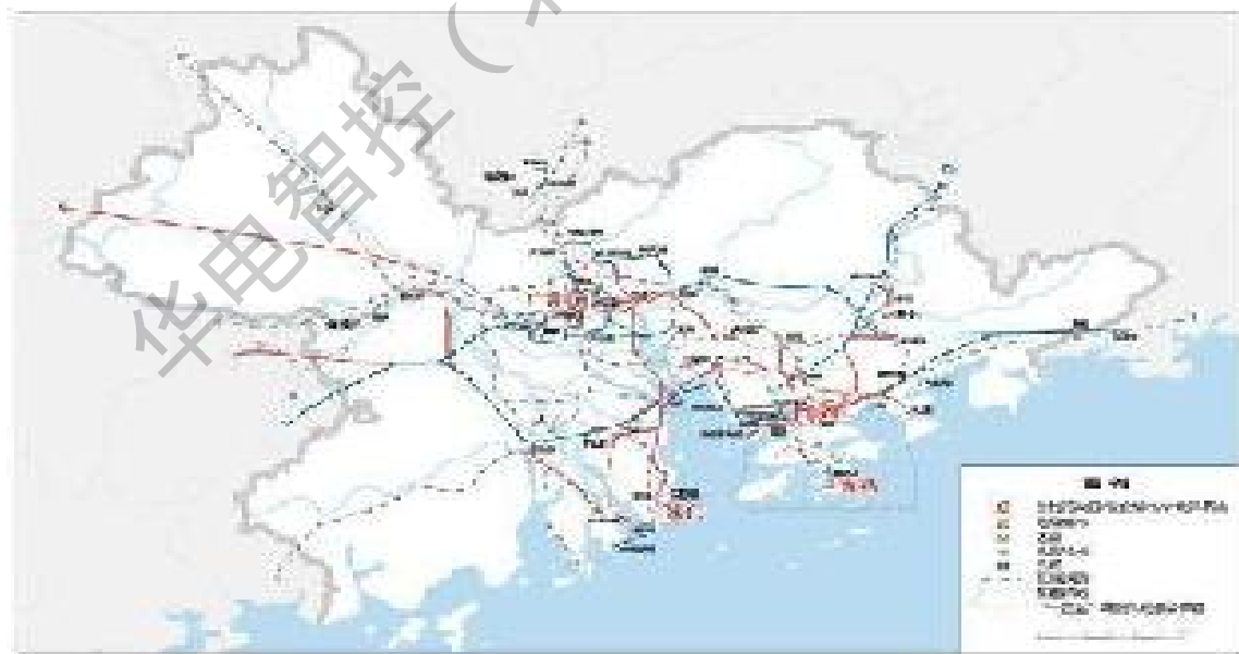
图 3 粤港澳大湾区城际交通规划图

加强粤港澳产学研协同发展，完善广深港、广珠澳科技创新走廊和深港河套、粤澳横琴科技创新极点“两廊两点”架构体系，推进综合性国家科学中心建设，便利创新要素跨境流动。加快城际铁路建设，统筹港口和机场功能布局，优化航运和航空资源配置。深化通关模式改革，促进人员、货物、车辆便捷高效流动。扩大内地与港澳专业资格互认范围，深入推进重点领域规则衔接、机制对接。便利港澳青年到大湾区内地城市就学就业创业，打造粤港澳青少年交流精品品牌。